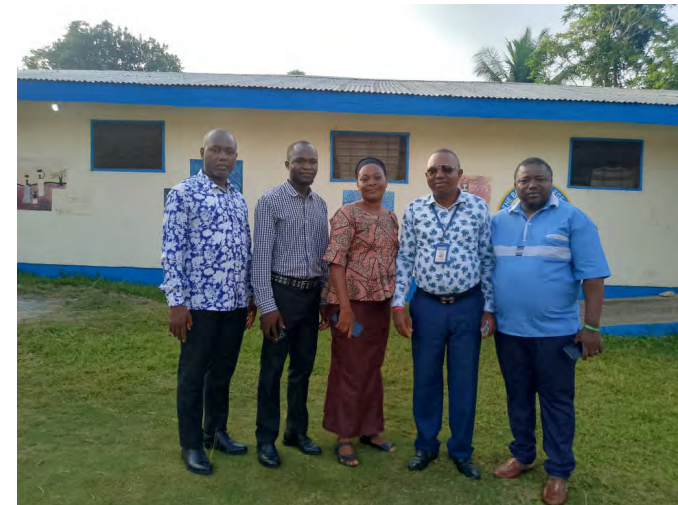
Reise nach Linberia