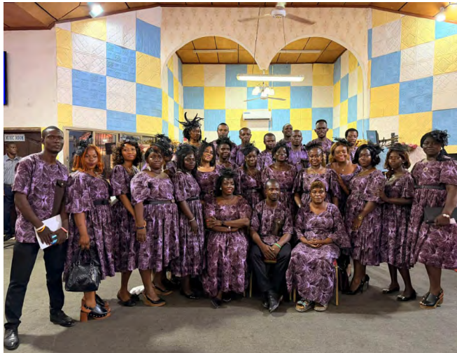
oben: Feier Junger Erwachsener in der Loko Baptist Church

Am Samstag, den 10. Mai 2025, organisierte die Baptistische Jugendvereinigung (BYPU) ein eintägiges Wanderprogramm für junge Menschen im westlichen Gebiet bei den Wasserfällen in Mambu, im Westen von Freetown.