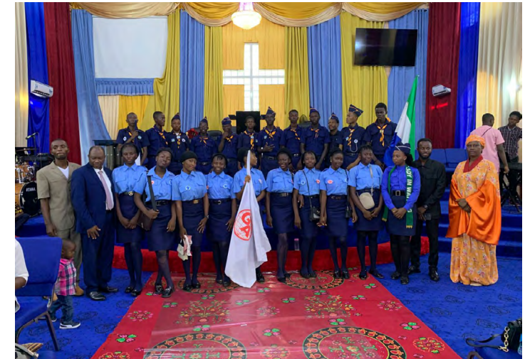
oben: „Royal Ambassadors“ und „Girls in action“