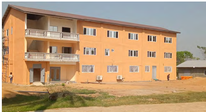
Neue BCSL-Office in Lunsar

Der Abend war geprägt von Spielen, unterhaltsamen Aktivitäten und gemeinschaftlichem Essen, was ihn zu einem Tag der Entspannung, des Zusammenhalts und der geistlichen Ermutigung machte.