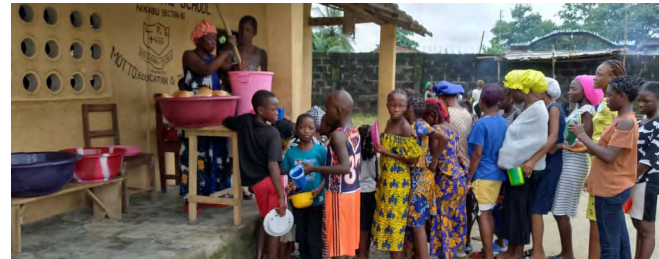
oben und unten: Kindercamp in Bo