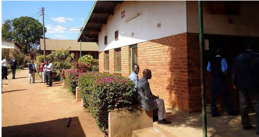
Das Theologische Seminar in Malawi