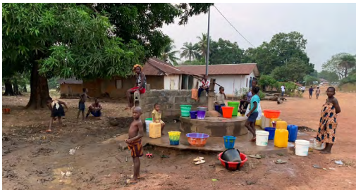
Ein Brunnen in Sierra Leone