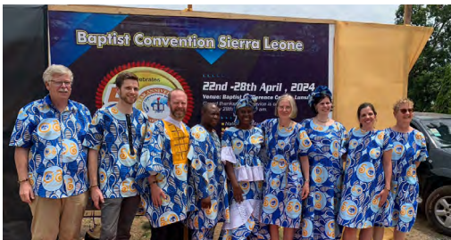
Unser Besuch in Sierra Leone 2024